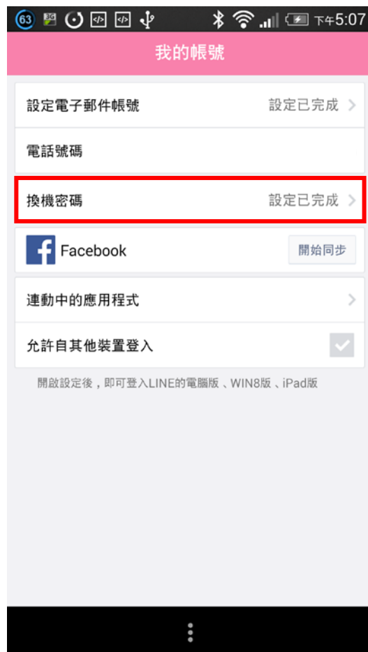
(二) 選取「換機密碼」，密碼要定期更換才安全喔！