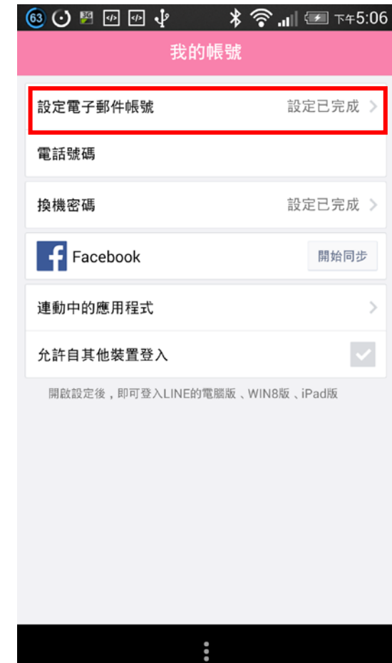
(二) 選取「設定電子郵件帳號」