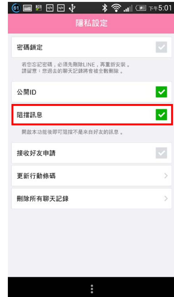
(三) 勾選「阻擋訊息」，完成後 非好友便不能再傳垃圾訊息 給你囉！