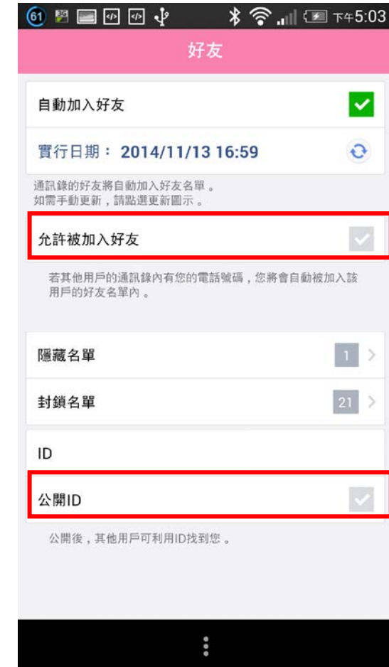
(三) 取消勾選「允許被加入好友」及「公開 ID」，完成後陌生人就無法任意將你加入好友了！