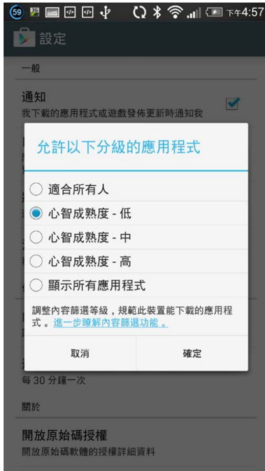
(四) 選取適合家中孩童的心智成熟度