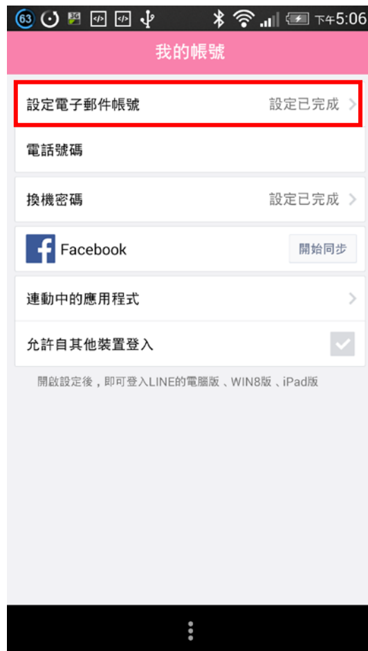
(一) 選取「設定電子郵件帳號」