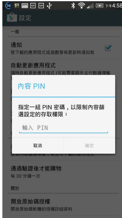
(五) 選取分級後，輸入密碼即完成設定