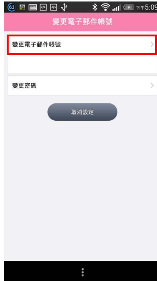
(二) 選取「變更電子郵件帳號」， 密碼要定期更換才安全喔！